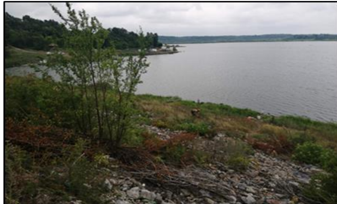
Слика 5 Језеро Паљуви

Огранак РБ „Колубара“ је обављала радове чисте сече на деловима МЗ Зеоке око окућница, МЗ Јунковац око пута, крчење противпожарног пута у МЗ Вреоци, за потребе трасирања шумских и противпожарних путева у МЗ Миросаљци, крчење бране на језеру Паљуви.