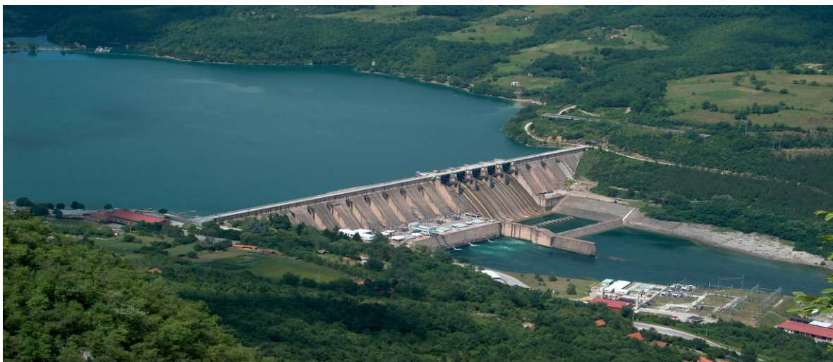
Слика 7 ХЕ Бајина Башта

Дринско-Лимске хидроелектране Бајина Башта (ДЛХЕ) је огранак у оквиру Јавног предузећа Електропривреда Србије (ЈП ЕПС), чија је примарна функција производња електричне енергије. Дирекција и постројења огранка се налазе у западној Србији, на територији градова: Бајина Башта, Нова Варош, Мали Зворник и Чачак. Огранак ДЛХЕ је направио овај План сарадње са заинтересованим странама (у даљем тексту План) са циљем унапређења сарадње са појединцима, заједницама, организацијама и институцијама које могу бити под утицајем активности огранка, које су заинтересоване за ове активности или могу утицати на њих. У Плану је описан и начин на који се заинтересоване стране могу обратити представницима ЈП ЕПС и огранка ДЛХЕ са својим питањима и представкама у вези активности огранка. Огранак ће пратити спровођење Плана и повремено га ажурирати убацивањем нових података и планираним активностима. Документ такође укључује жалбени механизам намењен заинтересованим странама како би могли да изнесу своје бриге у вези са активношћу или пројектом огранка ДЛХЕ. План је израђен у сагласности са законодавством Републике Србије, међународним стандардима захтеваним од стране Европске банке за обнову и развој (EBRD), као и других међународних финансијских институција и у складу са интерним процедурама ЈП ЕПС-а. План је жив документ и редовно ће се надгледати, разматрати и ажурирати по потреби.