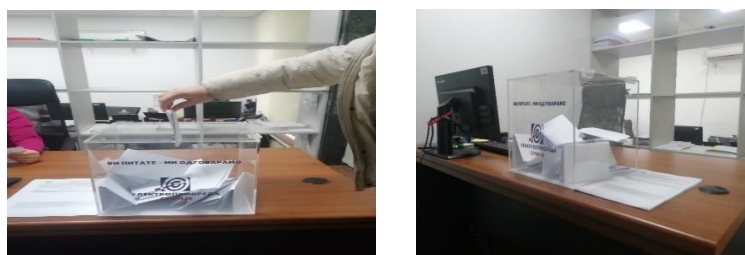
Слика 2 Кутија за пријем представки постављена на писарници ЈП ЕПС