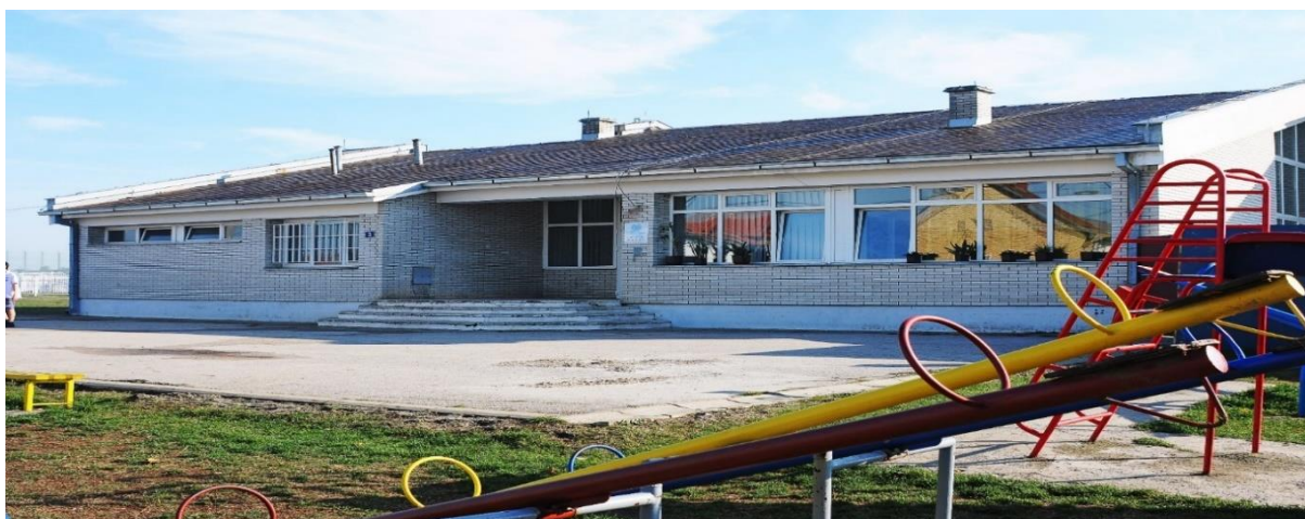
Слика 3 Основна школа у насељу Црне међе