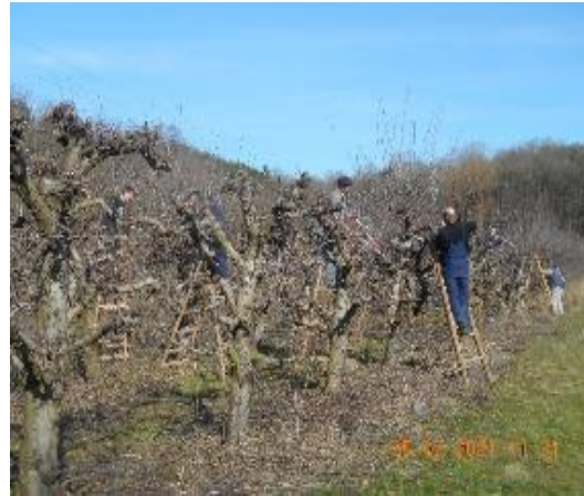
Слика 4 Почетак цветања пшенице и резидба воћног засада

Огранак РБ „Колубара“ је обављала радове чисте сече на деловима МЗ Зеоке око окућница, МЗ Јунковац око пута, крчење противпожарног пута у МЗ Вреоци, за потребе трасирања шумских и противпожарних путева у МЗ Миросаљци, крчење бране на језеру Паљуви.