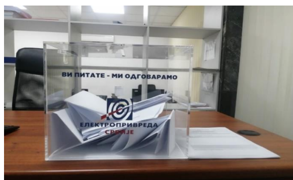
Слика 1 Кутија за пријем представки

Представка може бити дата у слободној форми или на обрасцу за представке, који је доступан за преузимање на веб сајту као и на писарницама ЈП ЕПС. Такође, ценећи потребе заинтересованих страна ЈП ЕПС је додатно увео и поставио кутије за пријем представки на више локација, (слике 1 и 2).