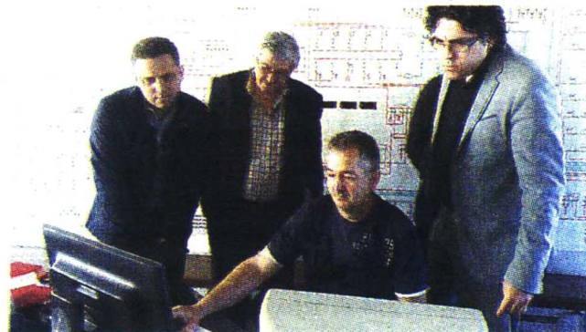
ПОЧЕТАК Пуштање у рад новог система

Електродистрибуција "Сурдулица" покренула је и обимне радове на изради по-