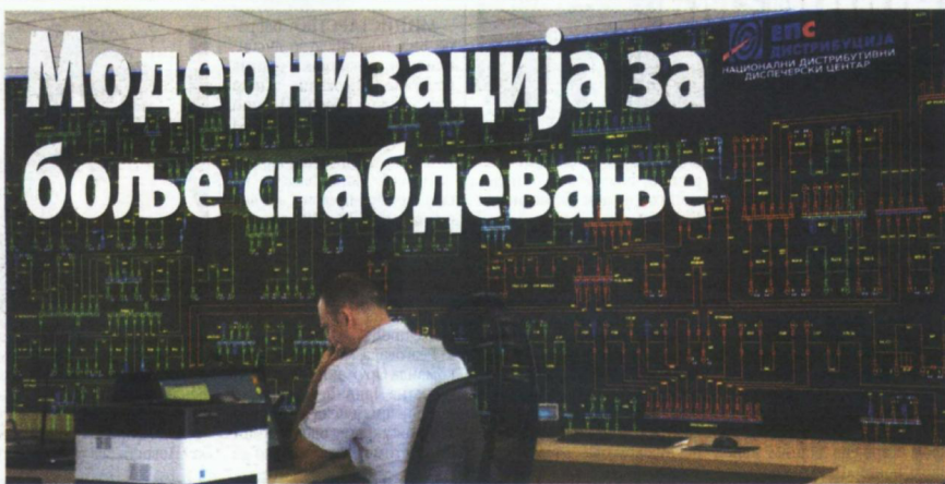
Национални центар и нове трафостанице широм Србије уводе најновије технологије

- Отварање овог центра је још један показатељ