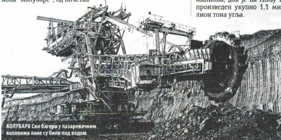
КОЛУБАРА Сви багери у лазаревачким коловима лане су били под водом

ра, а на откопавање јаловине највише утичу нерешени имовинско-правни односи и тешки техничко-технолошки услови за рад механизације. ■